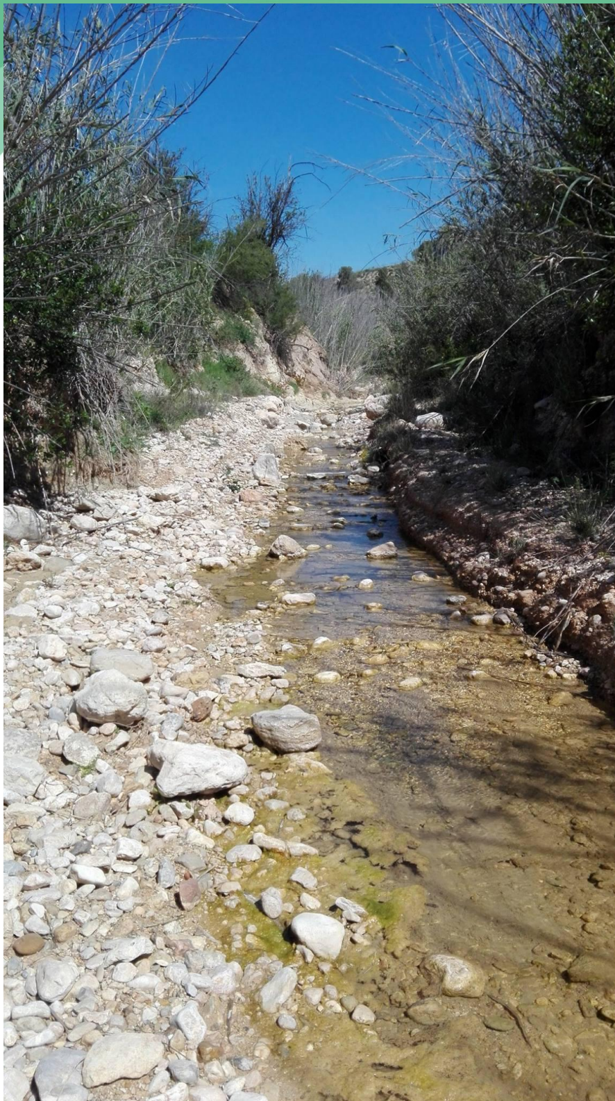
Ilustración 1 Rambla de Algeciras, en el mapa 1