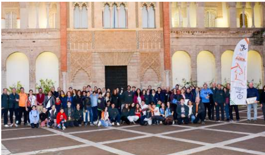
El Club ADOL

Agradecemos al Patronato del Real Alcázares y al Instituto Municipal de Deportes de Sevilla su colaboración para hacer posible la celebración de esta prueba.