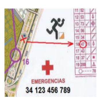
º DE TFNO. DE EMERGENCIAS DEL EJEMPLO NO ES REA

En el mapa figurará el número de teléfono móvil de emergencias del dispositivo sanitario de la prueba. En el caso de que un corredor debido a una lesión, caída, etc., precise ayuda y no pueda llegar por sus propios medios a la zona más cercana donde se ubican los servicios sanitarios (meta y zona de avituallamiento), el propio accidentado u otro corredor, procederán a comunicar la posición del accidentado con respecto al código del control más cercano (no confundir con el no de orden del control en el recorrido), con las indicaciones de dirección más precisas que sea posible (corredor accidentado 100 metros al N del control 47), según ejemplo adjunto. El procedimiento de aviso será por medio de otro corredor que lo notifique personalmente en meta, o a través de teléfono móvil.