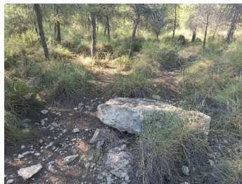
Piedra que NO destaca sobre el suelo