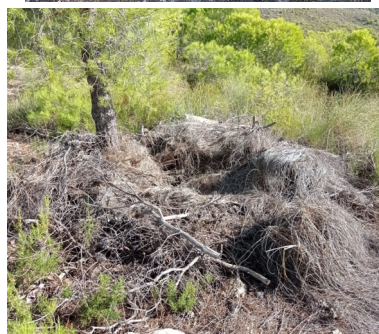
Puesto de caza (algunos en desuso o semi derruidos)