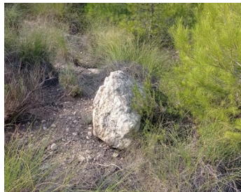
Piedra que destaca sobre el suelo

Abundan también los pinos de pequeño tamaño aislados en terreno despejado, muchos de los cuales no están incluidos en la cartografía para una mejor legibilidad.